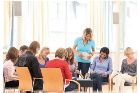
Studieren an der IHK Akademie