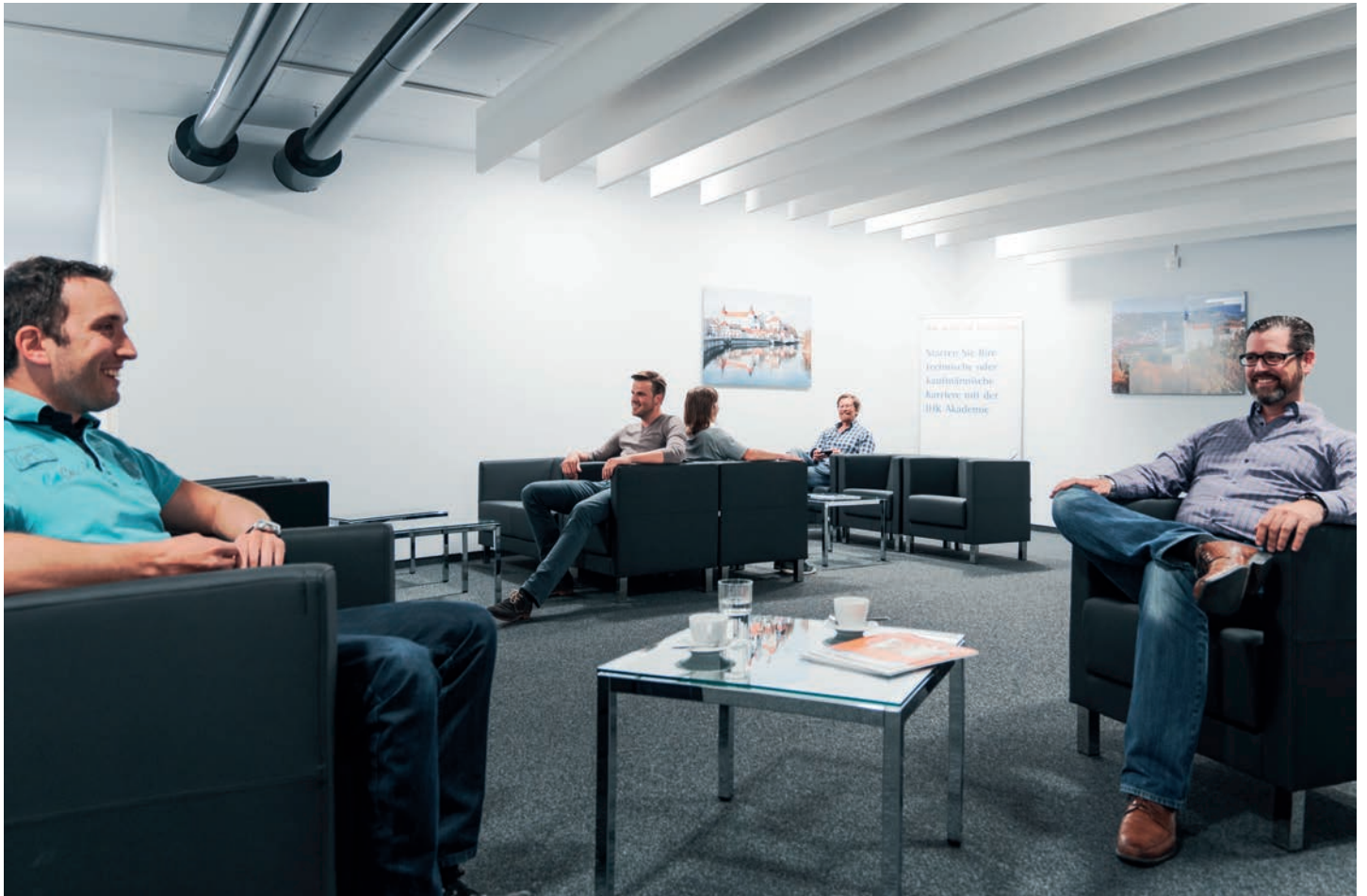
Optimale Lernatmosphäre und modernes Ambiente